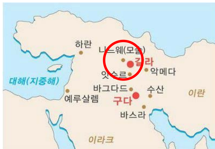
앗시리아의 수도 니느웨 (현재 이라크의 모술)

에돔이 멸망한 이유는 쌍둥이 동생인 ‘야곱’에게 폭력을 행사했기 때문이다. 예루살렘이 함락 되었을 때, 형제의 나라인 에돔은 예루살렘을 도왔어야 함에도 불구하고, 바벨론과 같이 약탈하는 만행을 일삼게 되어, 하나님의 진노를 사게되었고, 결국 하나님의 심판을 받아 멸망하게 된다. 오바다의 예언이 선포된지 200년 후에, 아랍계 유목민 ‘나바티안’ 족에 의해 ‘세일산’에서 쫓겨난다.